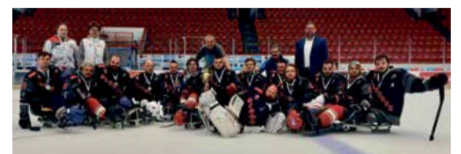
Soho Olomoučtí Kohouti obsadili na turnaji Olomouc Cup 2024 druhé místo.

4. Juniorská para hokejová reprezentace ČR, 5. Kazachstán, 6. Rennes Cormorans, 7. Para hockey Austria, 8. Suomi Paraleijonat