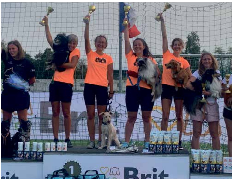
Mistrovství ČR v agility, které hostila minulý týden Mohelnice, zná své mistry pro letošní rok. Na snímku jsou mistři družstev kategorie M. Další mistrovství, tentokrát však plemene sheltie by mělo proběhnout už v sobotu 21. září v Nových Zámčích v areálu Dvora Nové Zámky u Litovic.