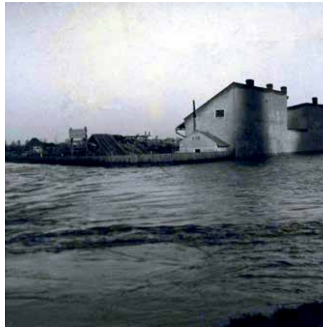
Lazce 1920

Všechny zmíněné povodně spojují obdobné scénáře: jarní tání či vydatné deště. Některé z historických událostí, které se těmto scénářům vymykají, si připomeňme slovy známého olomouckého historika Milana Ticháka: „Přece jen se někdy stalo, že režisérka příroda zvolila v Olomouci pro drama zvané povodeň scénář trochu jiný. Například v úterý 15. května 1911 - na svátek nelichotivým lidovým příslovím poctěné sv. Žofie - se nad Olomouckem rozpršelo a lilo bez přestávky až do neděle 20. května. V několika dnech spadlo 177 mm srážek (nejvíce 19. 5. - 54,2 mm). Na řece Moravě to bylo samozřejmě znát, ale „otužily“ Černovír, Lazce a Nové Sady to příliš z míry nevyvedlo. Tentokrát se o ojedinelou pohromu postaral nenápadný potůček tekoucí od Neředína k Olomouci. Říkali mu Nereteiner Dorfbach, české jméno pro svou nepatrnost snad ani neměl. Když se na konci předminulého století začala na katastru Nové Ulice stavět tzv. Úřední čtvrt a byla zde vybudována kanalizace, nastavili v roce 1895 na rohu dnešní ulice Dvořákovy a třídy Svornosti neředínskému potůčku do cesty kanalizační mříž, za níž voda bezpečně mizela i za silných deštů. Až do května 1911. Kanalizace - mj. ještě nenapojená na stokovou soustavu města Olomouce - nestačila zvýšený průtok potoka přijímat a voda vytvořila z ulic Ressler-