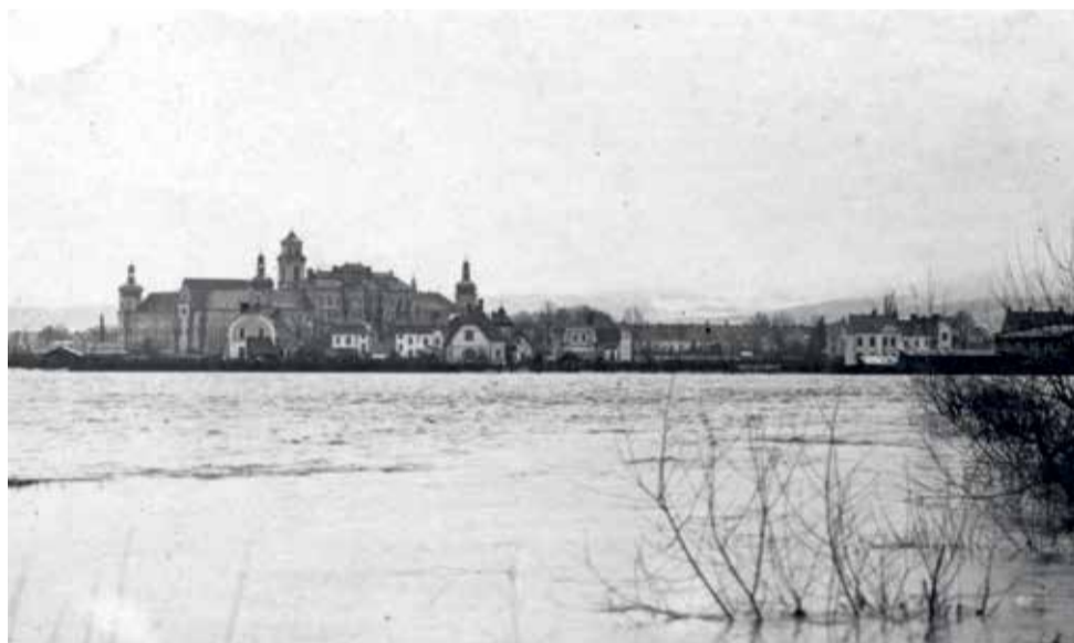
Hradisko 1920

Události, které právě prožíváme v hydrometeorologicky neklidném září roku 2024, se z popsání souhrnu povodní v Olomouci v předchozím století nevyvíjejí. Dvacetiletá voda některé městské části potrápila, jiné zůstaly ochráněny novým souborem protipovodňových opatření z posledních dekád, která prokázala svoji účinnost a ochránila podstatnou část města udržením vodního náporu v korytu. Pokud se v následujících desetiletích podaří na severu i na jihu města dokončit poslední etapy jeho ochrany, může se Olomouc vymanit z koloběhu pravidelných záplav z jarního tání a příválových deštů. Ochrana města proti extrémům přesahujícím katastrofické události roku 1997 je však i nad možností těchto mnohamiliardových investic státu a vyžadovala by výstavbu velkých vodních děl na horním toku Moravy. Přesto je výhled do budoucna z hlediska úrovně ochrany života, zdraví a majetku Olomoučanů výrazně optimističtější než v dosavadní historii města. ■