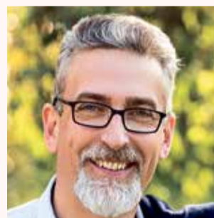
Mirek Zbánek primátor

Ptejte se vedení města Olomouce na e-mailové adrese otevrenaradnice@hanackyvecernik.cz a my Váš dotaz necháme zodpovědět!