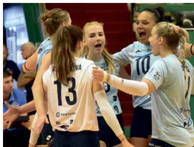
Volejbalistky VK Šantovka Olomouc obsadily na svém domácím turnaji druhé místo.

to občas nevychází, ještě to tedy není ideální. Máme momenty, kdy vše klapne, ale taky situace, kdy děláme zbytečné chyby a soupeř má body prakticky bez práce. Ale jsem rád, že jsme poslední zápas s Lemesosem dokázali otočit a vyhrát, být v pěti setech až v tie-breaku. Věřím, že formu ještě před startem nejvyšší soutěže posuneme.“